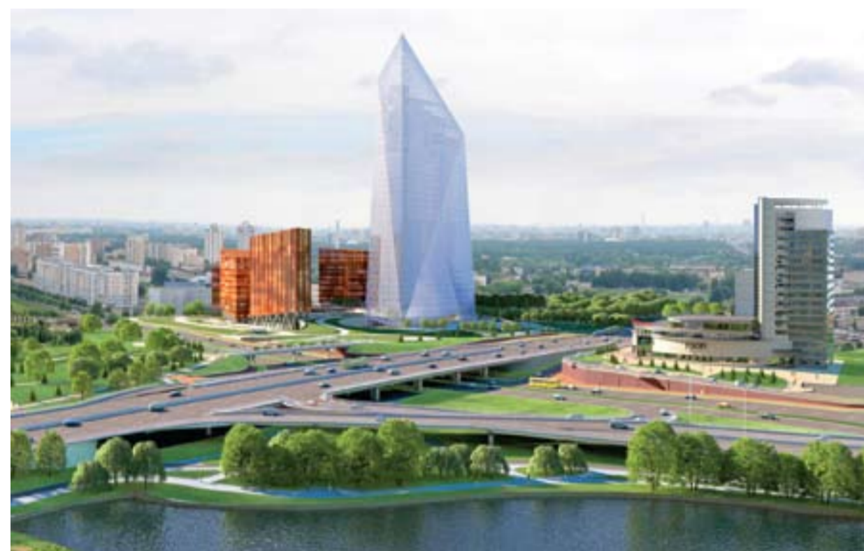
Общий вид МФК и транспортной развязки