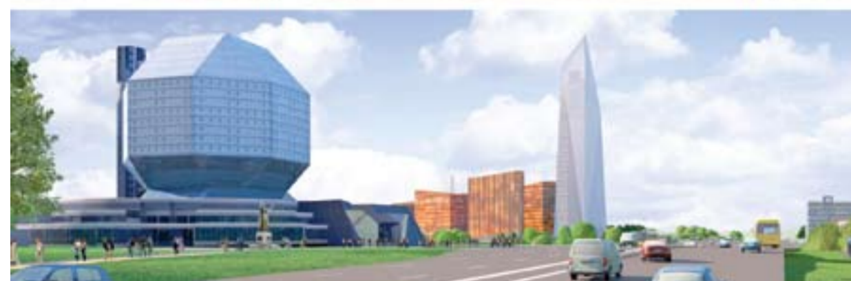
Виды от Национальной библиотеки